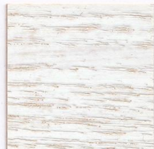
8855 Polarweiss / 800 Weiss**