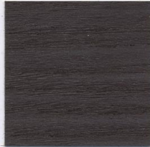
7086 Schokoladenbraun (ca. RAL 8017)