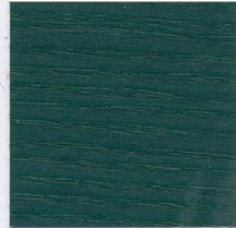
5172 Moosgrün (ca. RAL 6005)