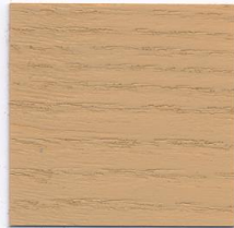
3166 Hellocker GORI-Aufhelltechnik