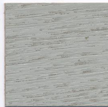
2052 Lichtgrau (ca. RAL 7035)